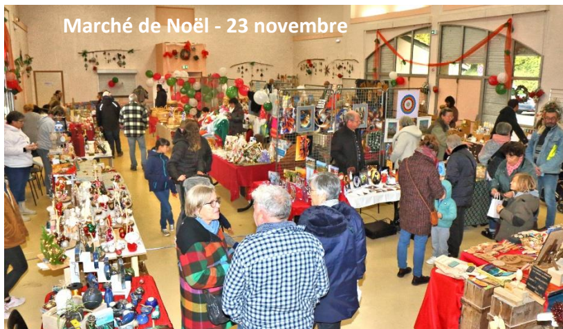
Marché de Noël - 23 novembre