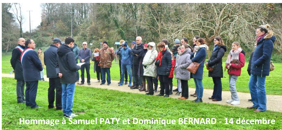
Hommage à Samuel PATY et Dominique BERNARD - 14 décembre