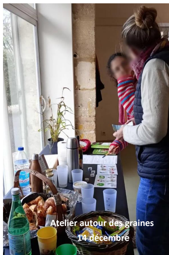
Atelier autour des graines 14 décembre