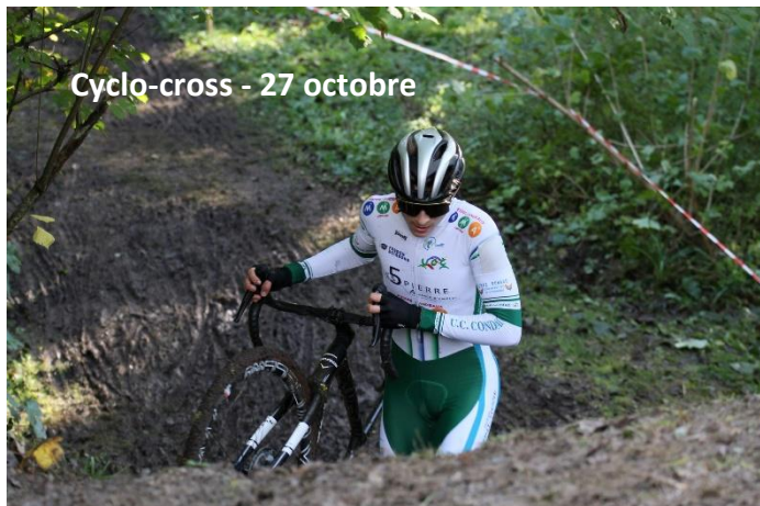
Cyclo-cross - 27 octobre