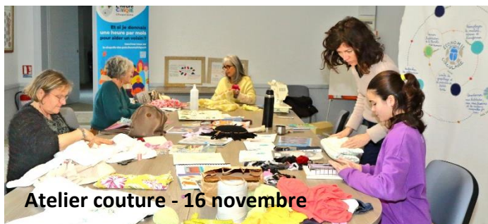
Atelier couture - 16 novembre