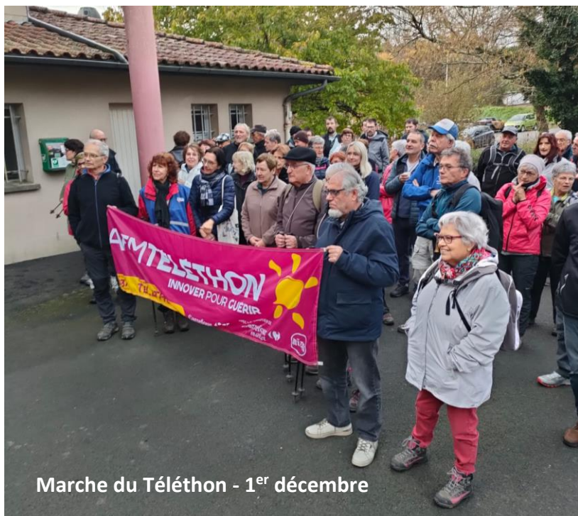
Marche du Téléthon - 1 er décembre