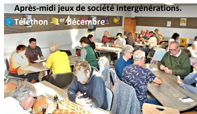
Après-midi jeux de société intergénérationnels.