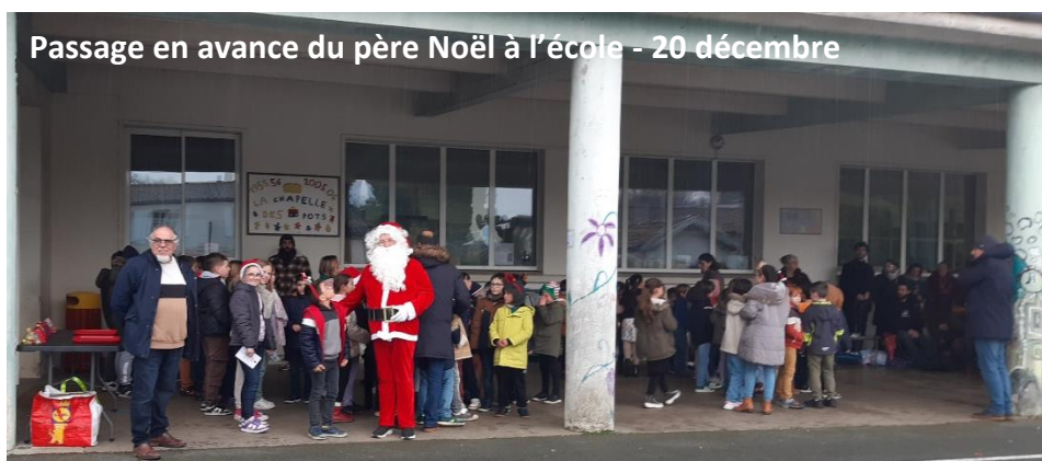
Passage en avance du père Noël à l'école - 20 décembre